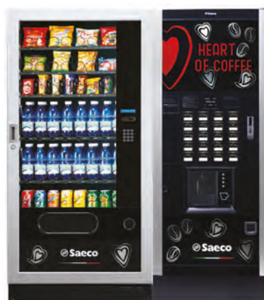
MegaCold L + Atlante Evo 700