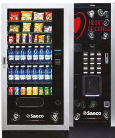
MegaCold L + Atlante Evo 500