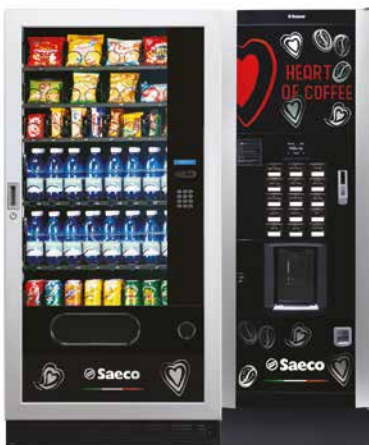
MegaCold L + Atlante Evo 500