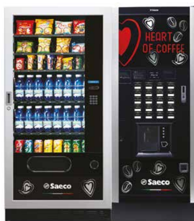
MegaCold L + Atlante Evo 700