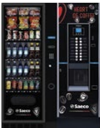
MegaCold S + Cristal Evo 400