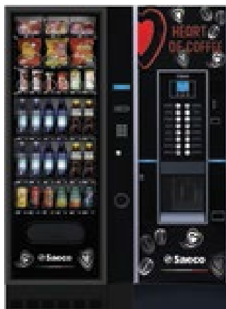
MegaCold M + Cristal Evo 600