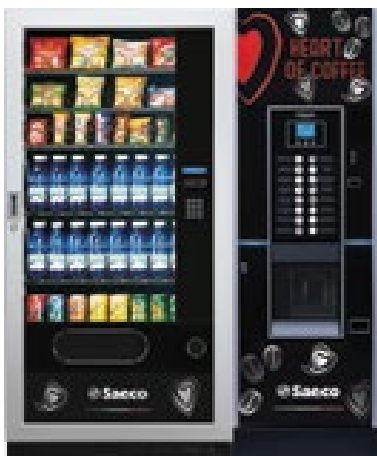
MegaCold L + Atlante Evo 500