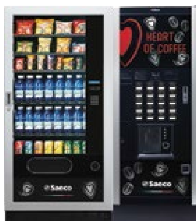
MegaCold L + Atlante Evo 700