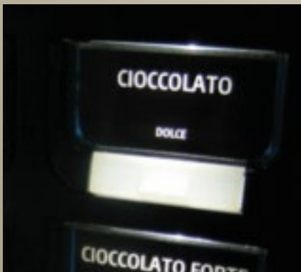
Mattweiße, beleuchtete Tasten zur besseren Produktauswahl