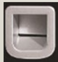
Hinterleuchtete Lexan Scheiben