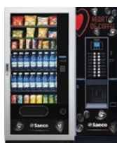
MegaCold L + Atlante Evo 500