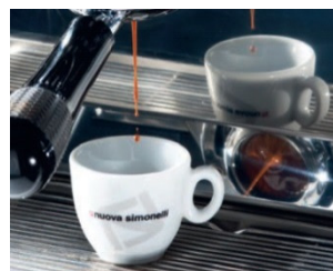
Reverse Mirror zur Kontrolle des Brühvorgangs