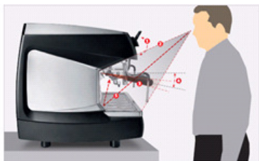
Beste Ergonomie zur einfachen Bedienung des Gerätes