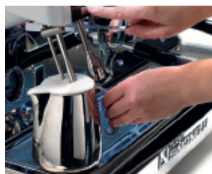
Elektronische Milchzubereitung für kinderleichte Milchschaumproduktion