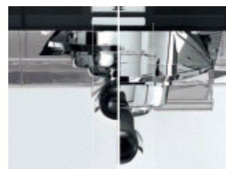
Unterschiedlich hohe Brühgruppen für alle Getränkearten bzw. Tassen / Gläser