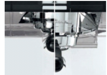
Unterschiedlich hohe Brühgruppen für alle Getränkearten bzw. Tassen / Gläser